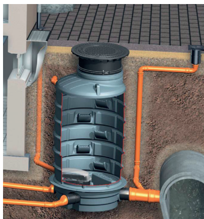
Przydomowa studzienka przeciwwzalewowa z polietylenu wyposażona w zawór zwrotny z pompą Pumpfix F