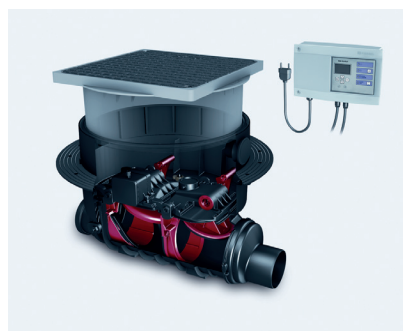
Automatyczny zawór zwrotny Staufix FKA Komfort