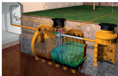
Przydomowa oczyszczalnia ścieków INNO-CLEAN

nie ma możliwości odprowadzenia ścieków do kolektora; dzięki zastosowaniu systemu z napowietrzaniem SBR (sekwencyjny reaktor biologiczny) wystarcza niewielka działka – jedynie pod zabudowę zbiornika oczyszczalni; wielkości nominalne są odpowiednie do wielkości gospodarstw z ilością mieszkańców od 4 (domek) do 50 (pensjonat)