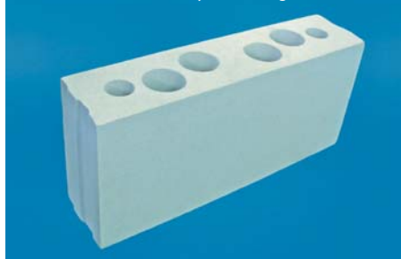
SILIKAT N 12/500 na ściany działowe gr. 12 cm