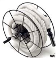
ROLLME – obrotowy wieszak na wąż ssący