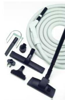
Zestaw do sprzątania