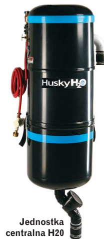
Jednostka centralna H20