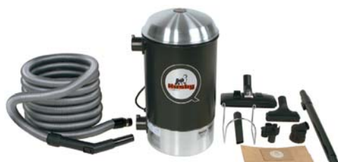
Zestaw Q COMPACT*