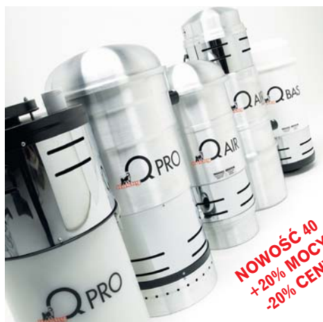
Nowa seria jednostek centralnych HUSKY 2005

Współpraca: firmy zainteresowane prosimy o wypełnienie ankiety na stronie: www.ankieta.odkurzacze.pl , szczegóły na stronie: www.wspolpraca.odkurzacze.pl