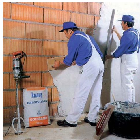
Tynki wewnętrzne nakłada się maszynowo (za pomocą agregatu) lub ręcznie

Tynki tradycyjne z zapraw cementowo-wapiennych wykonywane są obecnie głównie jako podkłady pod warstwy wykańczające np. z gładzi gipsowej lub okładziny z płytek ceramicznych. Zaprawy tynkarskie używane do ich nakładania mogą być przygotowywane bezpośrednio na budowie albo – co zdarza się coraz częściej – wykorzystuje się gotowe mieszanki dostarczane w workach lub silosach. Tynki cementowo-wapienne wykonuje się jako dwu- lub trójwarstwowe, przy czym pierwsza warstwa obrzutki pełni rolę warstwy kontaktowej, poprawiającej przyczepność. Następną warstwą narzutu o grubości 1–1,5 cm umożliwia wyrównanie podłoża i stanowi podkład pod gładź wykańczającą lub okładzinę. Przy nakładaniu tynku, w celu uzyskania równej powierzchni, stosuje się metalowe listwy tynkarskie, które wstępnie osadzone na ścianie, pełnią rolę prowadnic, po których prowadzona jest łąta wyrównująca powierzchnię narzutu. Przeciętne zużycie zaprawy przy tynkowaniu tradycyjnym wynosi 25–35 kg/m 2 zależnie od stopnia równości podłoża. Tynk cementowo-wapienny przyczynia się do wprowadzenia znacznej ilości wilgoci do pomieszczeń, co powoduje konieczność zapewnienia intensywnej wentylacji do czasu całkowitego jego wyschnięcia. Gruba warstwa wyprawy tynkarskiej pozwala na zakrycie prowadzonych po ścianie przewodów instalacji elektrycznej, co z kolei eliminuje konieczność wykonywania bruzd pod te przewody.