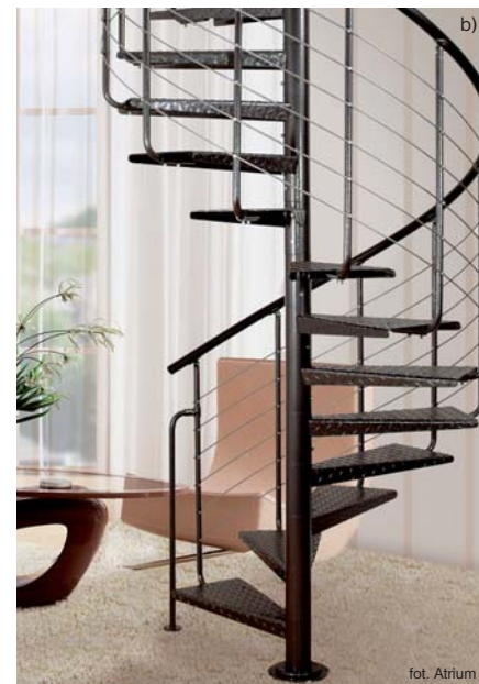
Oprócz schodów betonowych wykańczanych np. marmurem (a) i drewnianych wykonywanych na zamówienie można kupić lekkie schody modułowe, przeznaczone do samodzielnego montażu (b)