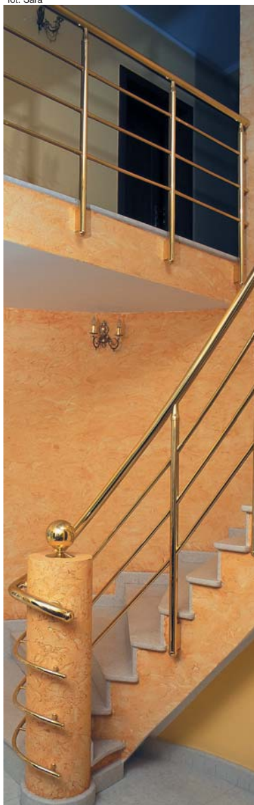
Balustrada mosiężna... ..i stalowa