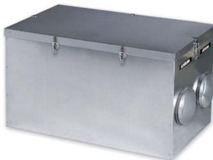
Centrala rekuperacyjna Enervent

Centrale Enervent są wyposażone w obrotowy wymiennik ciepła, dzięki któremu następuje odzysk ciepła oraz wilgoci.