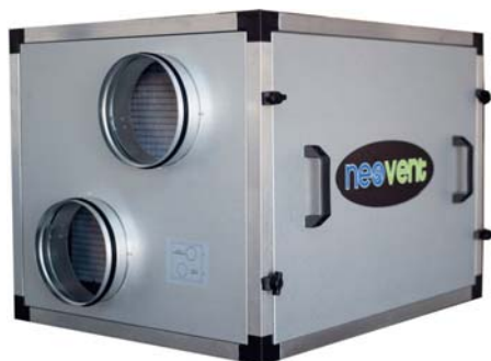
Centrala rekuperacyjna Neovent

Centrale rekuperacyjne Neovent PE wyróżniają się niskim zużyciem energii elektrycznej oraz bardzo cichą pracą, dzięki zastosowaniu wentylatorów z silnikami EC.