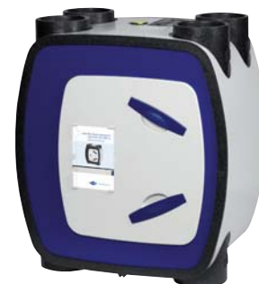
Centrala rekuperacyjna ITHO

Centrale rekuperacyjne ITHO wyróżniają się wysoką sprawnością termiczną: 96,2%, niewielką wagą (jedynie 24 kg) i małymi rozmiarami. Standardowo wyposażona jest w bezprzewodowy sterownik 3-biegowy z timerem, automatyczny zawór by-passu oraz zabezpieczenie przeciwzamrożeniowe.