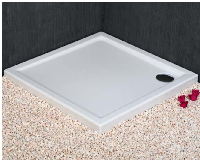
Brodzik akrylowy CORRINA

Aprobata i certyfikaty: EN ISO 9001:2000, Certyfikat ITB-340/02 (styropian), Aprobata Techniczna ITB (nośniki), Atest Higieniczny PZH (brodzik), Aprobata Techniczna ITB („compact”), Certyfikat niemiecki (dźwiękochłonność), Certyfikat na Znak Bezpieczeństwa B (palność)