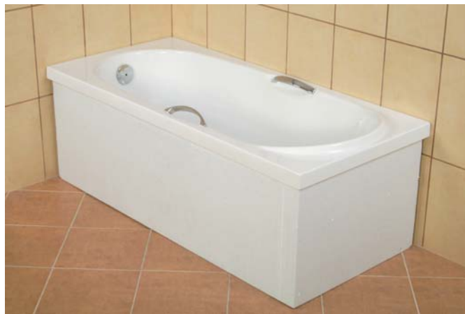
Wanny akrylowe na nośnikach