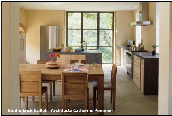
Studio Erick Saillet – Architecte Catherine Pommier