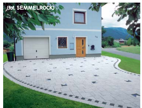
Naiczęściej ma kształt nieregularnych sześciątów, ale można również kupić kostkę o zaokrąglonych krawędziach

Jest bardzo trwała i efektowna, ale też sporo droższa od betonowej. Jest bardzo odporna na ścieranie i ściskanie. Im większe elementy, tym stabilniejsza nawierzchnia – dlatego mniejsze przeznaczone są do wykładania ścieżek, tarasów i podjazdów z przewidywanym niewielkim ruchem samochodów, większe – na nawierzchnie intensywnie użytkowane, na przykład podjazdy dla ciężkich samochodów. Najbardziej popularna jest kostka granitowa (w kolorach od jasnoszarego do żółtorudego), sjenitowa lub bazaltowa (w kolorze czarnym), a także z serpentynitu i piaskowca. Wymiary kostki kamiennej nie są podawane dokładnie, ale jako wymiar przybliżony, z tolerancją do 2-3 cm, ponieważ kostki te nie są cięte, lecz powstają przez odłupywanie z bloków skalnych.