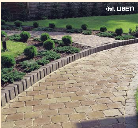
Nawierzchnie z kostki brukowej są wyjątkowo trwałe, a dzięki szczelinom pomiędzy elementami dobrze odprowadzają wodę

Zdecydowanie najbardziej popularnym materiałem nawierzchniowym jest kostka brukowa. Jest powszechnie dostępna, oferowana w szerokiej gamie kolorów i kształtów, niedroga, a przy odrobinie wprawy można ją ułożyć samodzielnie. Na dobrze wykonanej nawierzchni nie tworzą się kałuże, łatwo też z niej usunąć liście i piasek, a uszkodzony chodnik lub podjazd łatwo naprawić, wymieniając tylko zniszczone elementy.