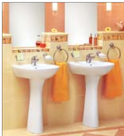
7 Eleganckie umywalki na postumencie

można stosować umywalki podwójne. Są one jednak znacznie droższe od pojedynczych.