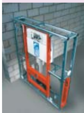
b – Po obudowaniu płytami gipsowo-kartonowymi z konstrukcji tej powstanie niska ścianka działowa z wiszącym sedesem (fot. Tece)

Do ściany murowanej mocuje się stelaże do zabudowy ciężkiej, które obmurowujemy (c), a następnie tynkujemy lub obkładamy płytami gipsowo-kartonowymi. Nie należy ich montować do ścian o lekkiej konstrukcji (z samych płyt g-k), ponieważ nie mają dostatecznej wytrzymałości. Jeśli stelaża nie można obmurować od dołu, należy dodatkowo zastosować stalowe wsporniki (tzw. nogi montażowe), mocowane do podłogi, które przeniosą obciążenia od miski ustępowej.