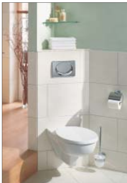
9 Miska ustępowa wisząca

pić sedes z odpływem poziomym (typ poznański) lub pionowym (typ warszawski). Trzecim rozwiązaniem jest miska ustępowa uniwersalna, będzie ona pasować do obu typów odpływów.