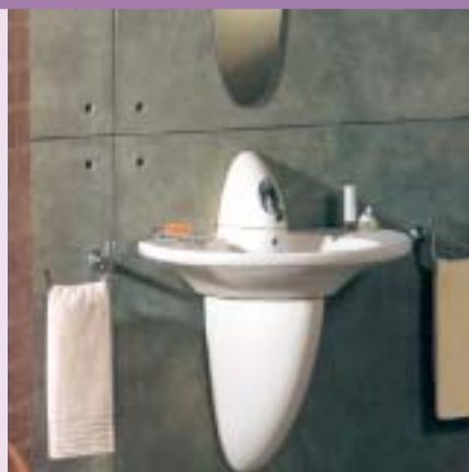
Bez tego półpostumentu dopasowanego kształtem do baterii efekt byłby mierny

Jednak poza względami estetycznymi postument i półpostument mają do spełnienia określone funkcje. Nie tylko zakrywają nieestetyczne podłączenia wodne i kanalizacyjne, ale także podtrzymują umywalkę. Są niezbędne zwłaszcza przy dużych umywalkach, które nie są mocowane na szafce lub stojącym stelażu. Zaletą postumentu w stosunku do półpostumentu jest możliwość obciążenia go większymi i cięższymi umywalkami, a wadą – trochę trudniejsze utrzymanie podłogi w czystości.