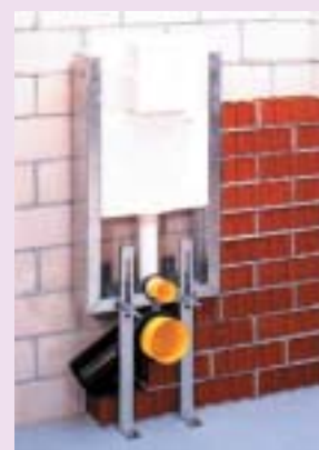
c – Stelaż do zabudowy ciężkiej zamurowuje się ceglami

Przy ściankach gipsowo-kartonowych montujemy stelaże do zabudowy lekkiej. Wykonane są one z wytrzymałych ram stalowych, tzw. samonośnych. Konstrukcja ramy jest na tyle stabilna, że po zamontowaniu i obciążeniu płytami gipsowo-kartonowymi wytrzyma obciążenie: do 400 kg (miska ustępowa i bidet) i do 200 kg (umywalka). Stelaże te można montować zarówno do lekkich ścian działowych, jak i do ścian masywnych, a także łączyć z metalowymi profilami konstrukcyjnymi w tak zwane ścianki instalacyjne. Firmy oferują także zestaw elementów do zbudowania w tym systemie szachtu instalacyjnego lub zamontowania wybranego urządzenia (np. miski ustępowej) w rogu pomieszczenia.