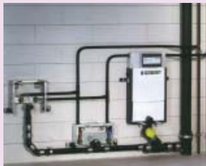
a – Do różnych urządzeń sanitarnych są różne stelaże instalacyjne: patrząc od lewej pierwszy jest do umywalki, drugi - bidetu, trzeci - miski ustępowej

Możemy zamontować pojedynczy stelaż, np. pod miskę ustępową albo kilka stelaży, oddzielnych do każdego z urządzeń. Stelaże te można mocować do konstrukcji zbudowanej z szyn montażowych, mocowanych do ścian i podłogi. Oszczędza to czas i umożliwia np. budowanie niskich ścianek działowych oraz dzielenie łazienki na strefy (b).