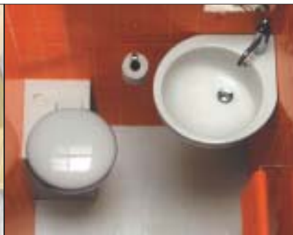
5 Umywalka narożna dobrze się sprawdzi w małej łazience

o kształtach fantazyjnych, jak np. umywalka pokazana na zdjęciu 3 .