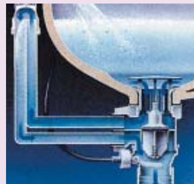
Zasada działania przelewu Clou

■ przelew typu Clou . Standardowo w umywalkach otwory przelewowe są w tylnej ścianie. Zapobiegają one przed zalaniem łazienki, w sytuacji gdyby ktoś nie zakręcił wody, a zatkał odpływ. Ale można zastosować rozwiązanie, w którym przelew stanowi element syfonu. Zasada działania przelewu typu Clou pokazana jest na rysunku.