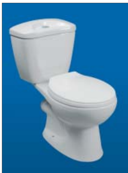
10 Kompaktowa miska ustępowa

Możemy wybrać sedes wiszący 9, stojący – kompaktowy 10 lub zwykły, a także narożny. Miski stojące łączymy ze spłuczkami – dolno- lub górnopłukiem. Górnopłuki produkowane są z tworzywa sztucznego i bardzo rzadko obecnie stosowane. Dolnopłuki mogą być wykonane z ceramiki lub tworzywa sztucznego. Mają różne wymiary; może-