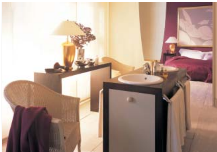
6 O efekcie decydują białe umywalki wpuszczone w ciemną szafkę