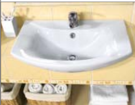
4 Umywalka o nietypowym kształcie z półką przylegającą do ściany

Szklivo, którym są pokrywane wyroby, może się różnić jakością w zależności od producenta. Możemy kupić ceramikę pokrytą specjalnymi powłokami, które dodatkowo zapobiegają powstawaniu osadów, dzięki czemu łatwiej utrzymać ją w czystości.