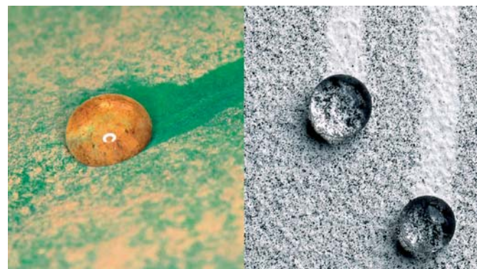
Kropla deszczu spływając po liściu lotosu zabiera ze sobą zanieczyszczenia

Więcej informacji u doradców handlowych Sto-ispo i na stronie www.sto.pl