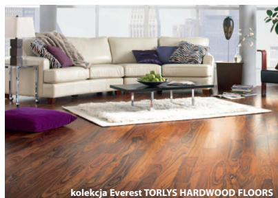
kolekcja Everest TORLYS HARDWOOD FLOORS