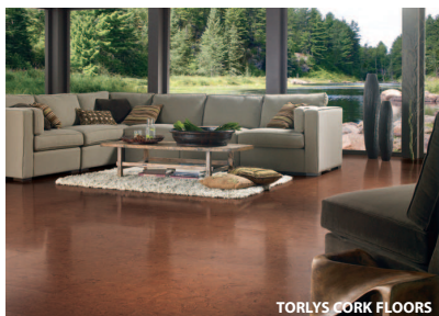
TORLYS CORK FLOORS