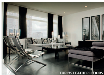
TORLYS LEATHER FLOORS