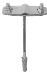
Uchwyt do bednarki i drutu

Nagrody: Solidna Firma, Gazele Biznesu, Złoty Laur Konsumenta, Przedsiębiorstwo Fair Play, Euromarka