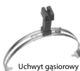
Uchwyt gąsiorowy uniwersalny