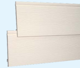
Deska ze strukturalną imitacją drewna 167 mm