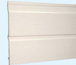
Deska podwójna ze strukturalną imitacją drewna 333mm

W wyniku wykorzystania specjalnych technologii drewnopodobna struktura na powierzchni desek ze spienionego PVC nadaje systemowi okładzin elewacyjnych prawdziwie naturalny wygląd.