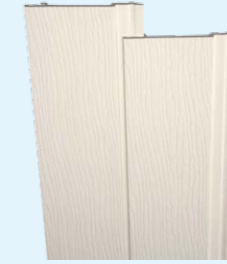
Deska z wydłużonym piórem ze strukturalną imitacją drewna 167mm