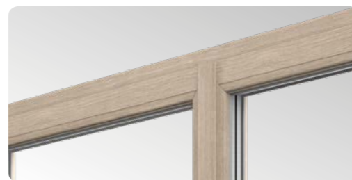
Smukłe profile z wąskim słupkiem wyposażonym w podwójne uszczelnienie, co stanowi nowość w tego typu rozwiązaniach na rynku.