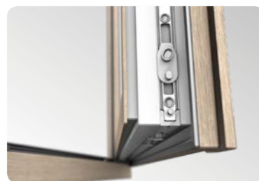
Wysokiej jakości okucie Maco Multi Matic KS z dwoma zaczepami antywyważeniowymi w standardzie.