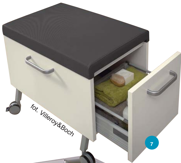
7 fot. Villeroy&Boch

Dlatego tylko od nas zależy, co wybieremy. Może błyszczące fronty z lakierowanego MDF w jednym z najmodniejszych kolorów: kardynalskim fiolecie, głębokim burgundzie, oleistej czerni... Takie meble wejść w doskonały mariaż ze szklanym żyrandol-