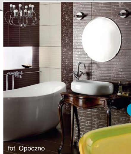
4 fot. Opoczno