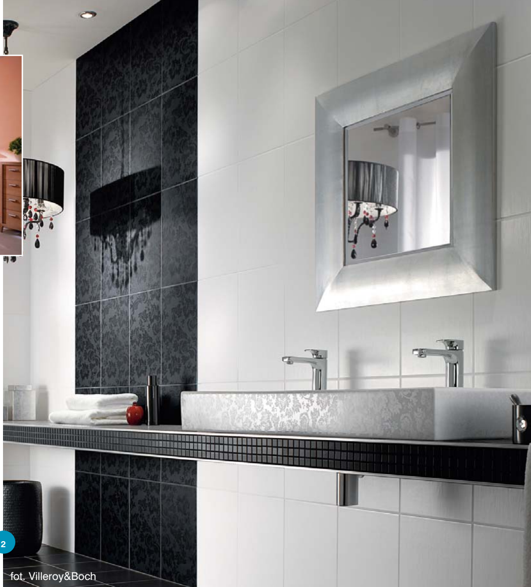
2 fot. Villeroy&Boch

6 Na zapas. Originalny koszyk Bloq firmy Geesa, na podręczną zapasową rolę papieru; nie trzeba jej szukać w głębinach szafek. Cena ok. 180 zł