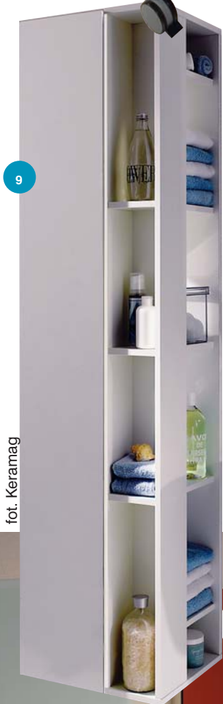
9 fot. Keramag

7 Jazda dowolna. Tapicerowany zasobnik na kółkach – reprezentant kolekcji Lifetime, zrodzonej w wyobraźni projektanta Reinera Molla. Jej idea łączy najnowsze rozwiązania ze sfer ergonomii i komfortu. Mebel może być szafką pod umywalkę, stołkiem do zabiegów pielęgnacyjnych, wolnym elektronem... Uchwyty w postaci stalowych łuków lub gałek