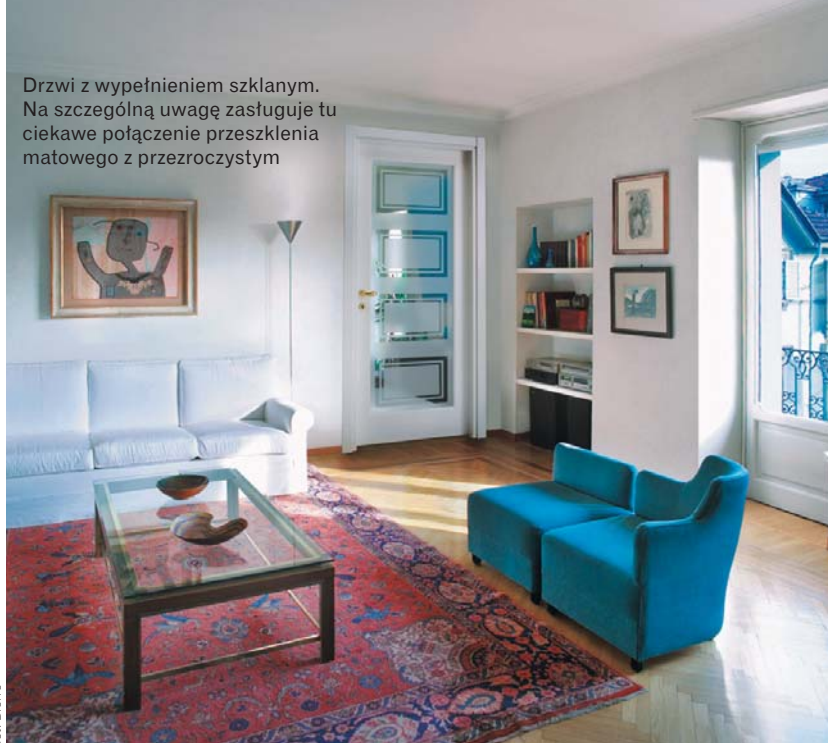
Drzwi z wypełnieniem szklanym. Na szczególną uwagę zasługuje tu ciekawe połączenie przeszklenia matowego z przezroczystym