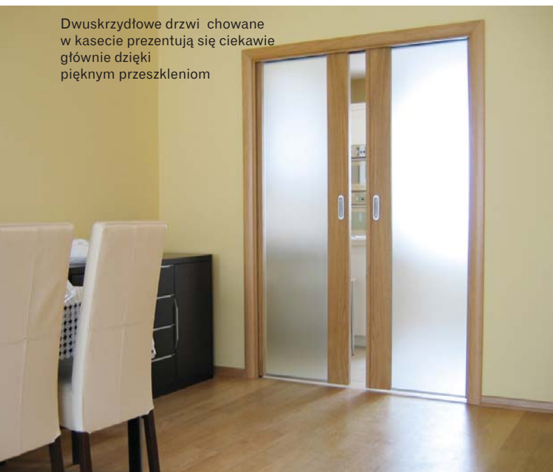
Dwuskrzydłowe drzwi chowane w kasecie prezentują się ciekawie głównie dzięki pięknym przeszkleniom