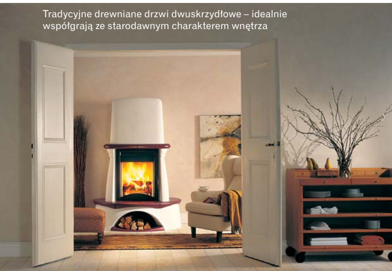
Tradycyjne drewniane drzwi dwuskrzydłowe – idealnie współgrają ze starodawnym charakterem wnętrza