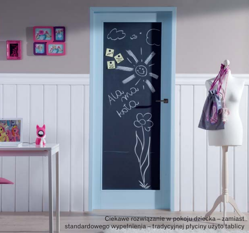
Ciekawe rozwiązanie w pokoju dziecka – zamiast standardowego wypełnienia – tradycyjnej płytki użyto tablicy