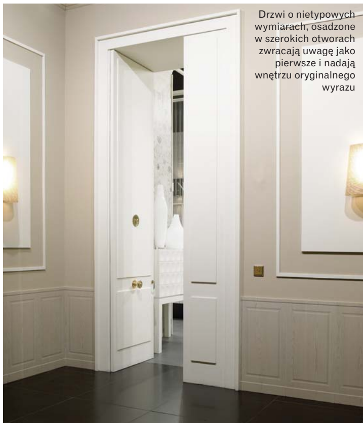
Drzwi o nietypowych wymiarach, osadzone w szerokich otworach zwracają uwagę jako pierwsze i nadają wnętrzu oryginalnego wyrazu