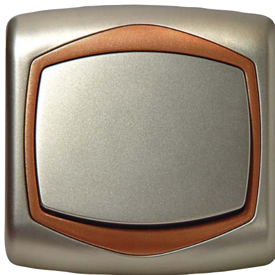
TON - ŁĄCZNIK JEDNOBIEGUNOWY SATYNA + MIEDŹ

telefoniczne, komputerowe, komputerowo-telefoniczne i głośnikowe (Gazela i Ton).