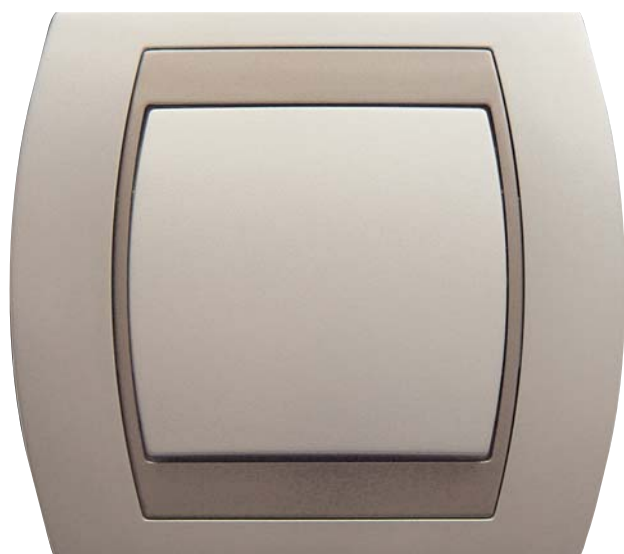
GAZELA - ŁĄCZNIK JEDNOBIEGUNOWY SREBRO + TYTAN

W ramach każdej z wymienionych serii znajdziecie Państwo: łączniki z podświetleniem i bez, ściemniacze (oprócz serii Top), gniazda wtyczkowe z uziemieniem i bez oraz gniazda specjalistyczne: antenowe,