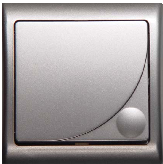
EFEKT – ŁĄCZNIK JEDNOBIEGUNOWY SREBRO

W mieszkaniach, gdzie odnajdziemy w wystroju kolory pastelowe, osprzęt czy też ramkę można kolorystycznie dopasować do koloru ściany lub też do koloru przeważającego w danym wnętrzu. Natomiast dla tych, których nie udaje się przekonać do ubarwienia swojego domu, czy też najlepiej czują się