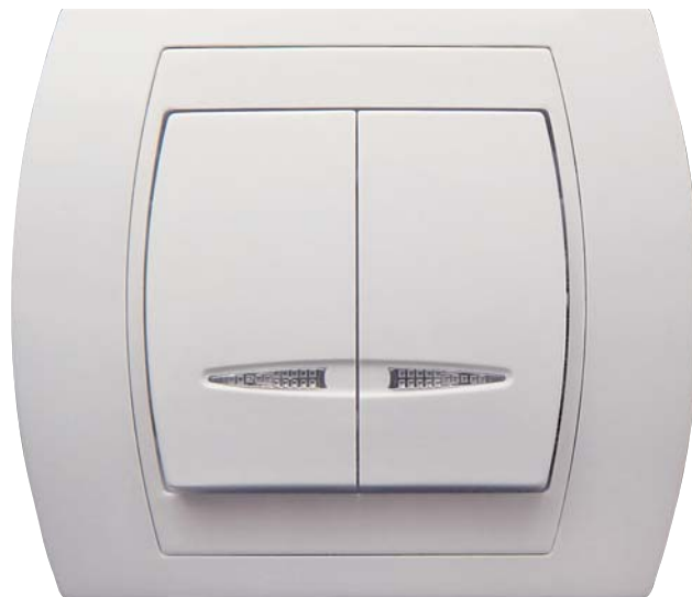
GAZELA – ŁĄCZNIK DWUGRUPOWY Z PODŚWIETLENIEM

Dodatkowo produkty z serii Gazela i Ton można nabyć bez ramki zewnętrznej, którą proponujemy Państwu w kolorach pastelowych i metalizowanych: