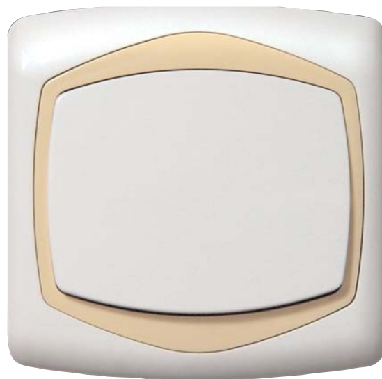
TON – ŁĄCZNIK JEDNOBIEGUNOWY Z WEWNĘTRZNĄ RAMKĄ BEŻOWĄ