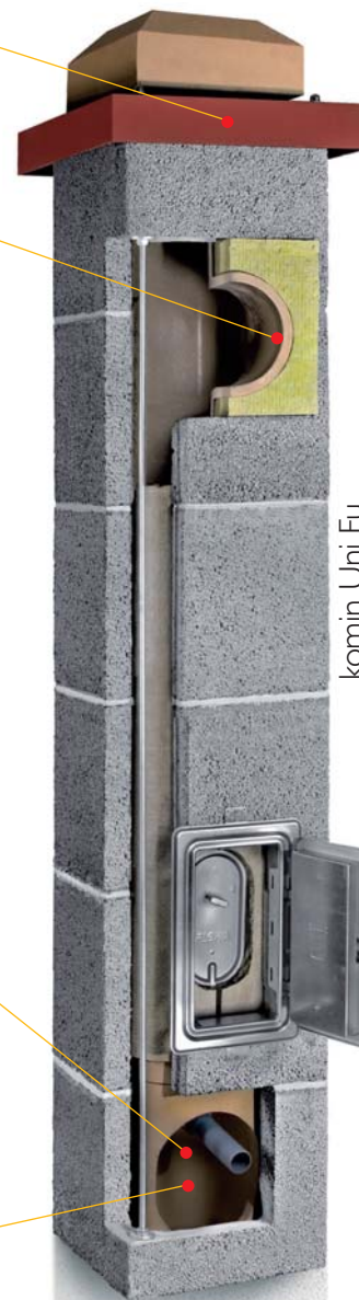
komin Uni Fu