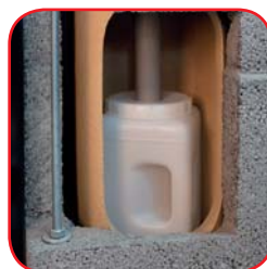
Naczynie do odprowadzania kondensatu