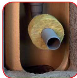
Odprowadzenie kondensatu do kanalizacji