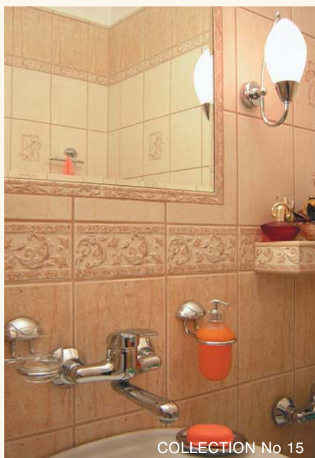
COLLECTION No 15

W skład każdej Kolekcji wchodzi kilkanaście elementów m.in. różnego typu wieszaki na ręczniki, mydelniczki, uchwyty na kubek, podajnik do papieru toaletowego, półki na kosmety-