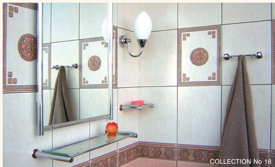
COLLECTION No 18