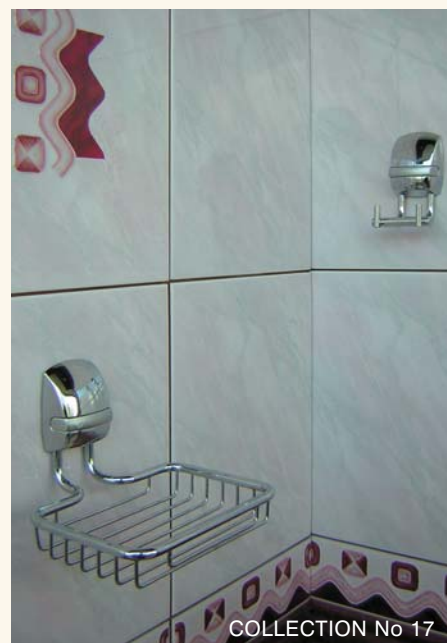
COLLECTION No 17