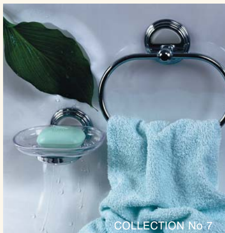
COLLECTION No 7

ki, szczotki WC z uchwytem, lustra i kinkiety. Elementy pakowane są pojedynczo w estetyczne i trwałe, ekologiczne opakowania, zawierające in-