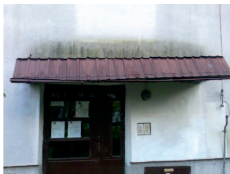
Docieplona elewacja systemem BSO z tynkiem bez wapna. Wygląd po 8 latach

Uważam, że czynnikiem najbardziej destrukcyjnym i degradującym budowlę jest woda. Dotyczy to nie tylko fundamentów, ale również tynków. Wszędzie tam, gdzie są one wystawione na długotrwałe oddziaływanie wilgoci, z czasem mogą pojawić się także grzyby i glony. Dlatego powinniśmy zadbać o takie