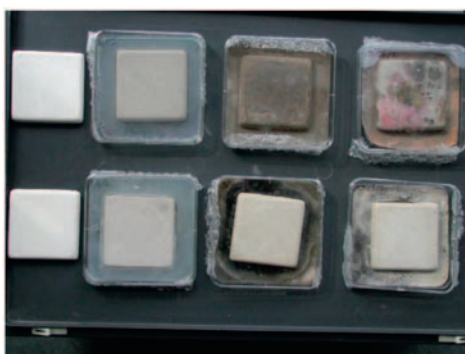
Porównanie oddziaływania grzybów na podłoże z wapnem (na dole) i bez wapna (na górze)