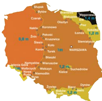
Podział na strefy przemarzania gruntów w Polsce

Uszkodzenia mogą też powstać wiosną, gdy grunt z jednej strony budynku rozmarznie, a z drugiej jeszcze nie. Wsadzanie występuje w gruntach organicznych, torfach, namulach, glinach, ilach i piaskach pylastych. Gdy mamy do czynienia z takimi gruntami dom trzeba posadzić poniżej tzw. granicy przemarzania (w zależności od obszaru Polski 0,8-1,4 m).