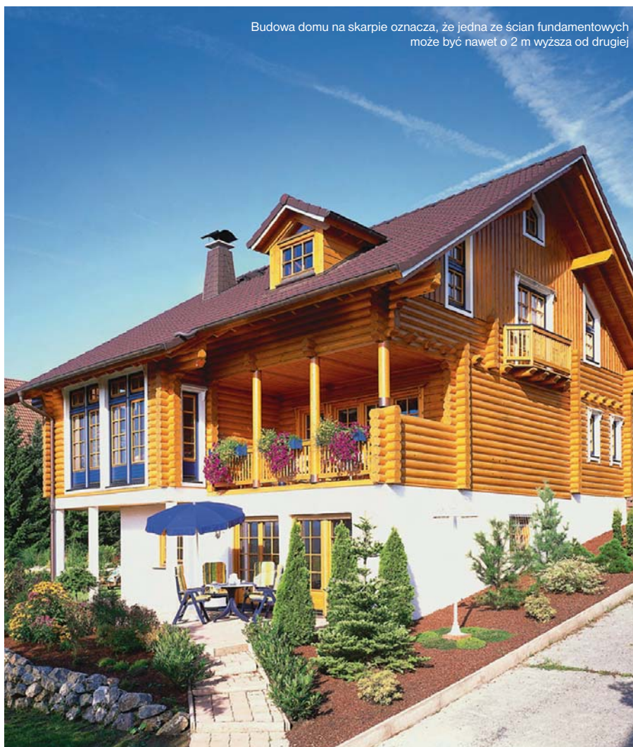
Budowa domu na skarpie oznacza, że jedna ze ścian fundamentowych może być nawet o 2 m wyższa od drugiej

Największe niebezpieczeństwo powstaje wtedy, gdy działka znajduje się na skarpie lub zboczu o dużym kącie nachylenia. O wyborze takiego miejsca zwykle decydują walory widokowe. Należy się liczyć z ryzykiem niestępczości gruntu, szczególnie wtedy, gdy ziemia nasiąknie np. wskutek obfitych opadów deszczu. Grozi to nawet osunięciem i zniszczeniem całego domu lub jego części.