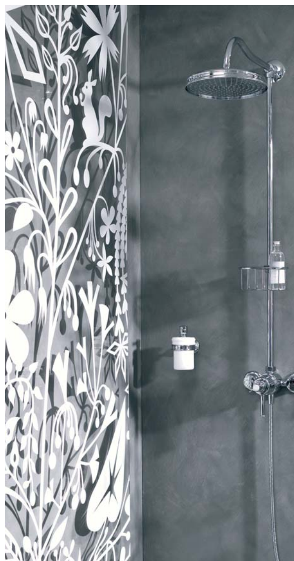
Axor Montreux Showerpipe