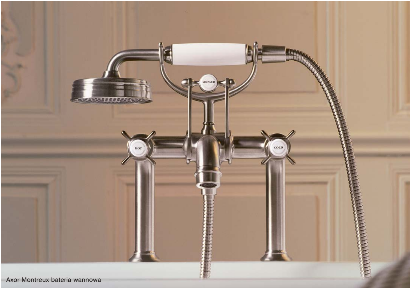
Axor Montreux bateria wannowa