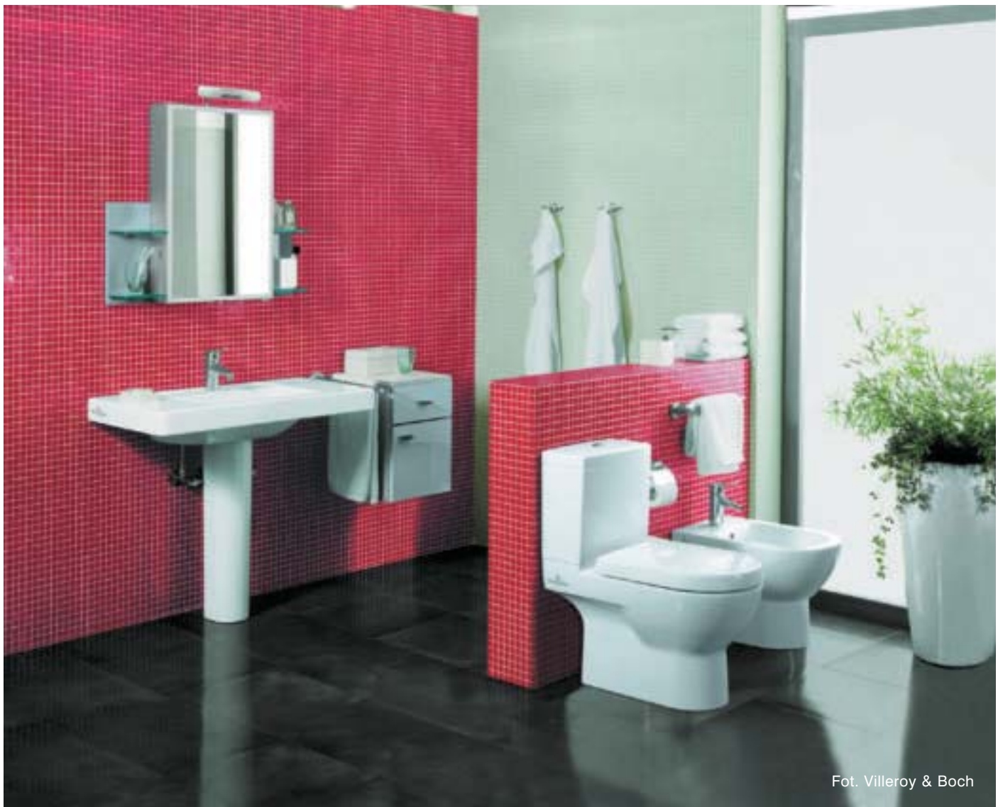
Fot. Villeroy &amp; Boch

Za projektowanie sprzętów do łazienki wzięli się projektanci o znanych nazwiskach... stąd taka różnorodność fasonów, kolorów, surowców. Szczególnie umywalki produkowane są w tej chwili z najróżniejszych materiałów, na przykład ze stali nierdzewnej, tworzyw sztucznych, kamienia, szkła, a nawet drewna, najpopularniejsze są jednak nadal te z różnego rodzaju ceramiki. I dlatego nazwa, choć już nie całkiem adekwatna, została.